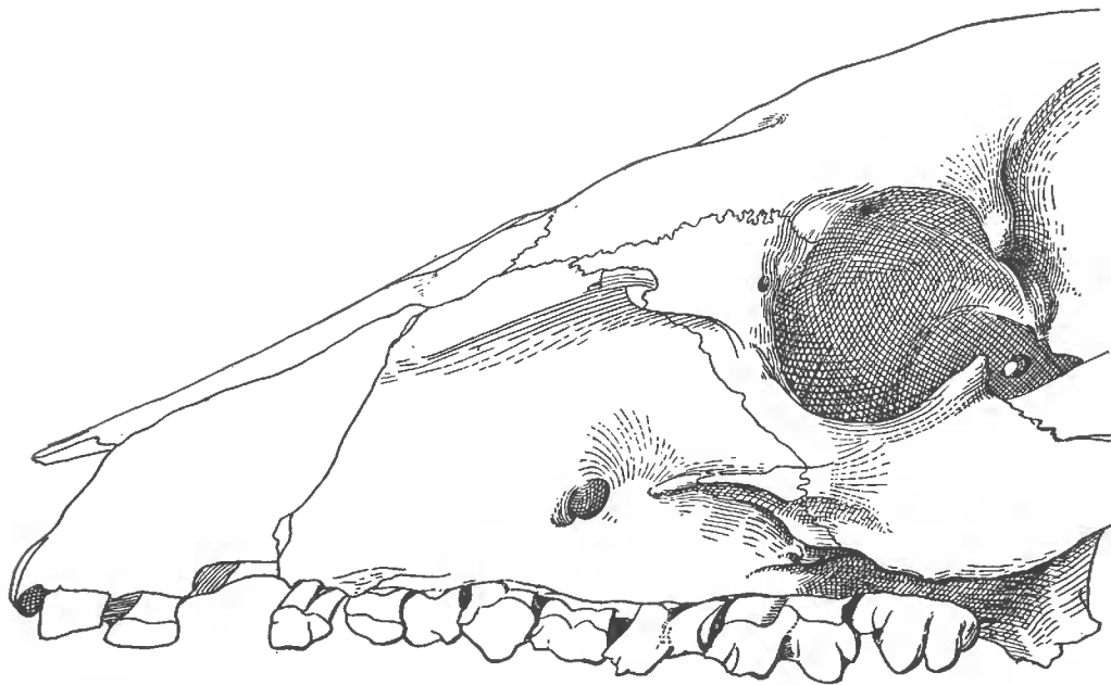
FIG. I. — Sus salvanius , grandeur naturelle.

I. — Dans la vaste région comprenant l'Asie Orientale et l'Inde, vivaient, à la fin des temps miocènes, de très nombreux Suidés. Parmi ces animaux, trois espèces, — au total très différentes entre elles, — présentaient cependant un caractère commun qui donnait